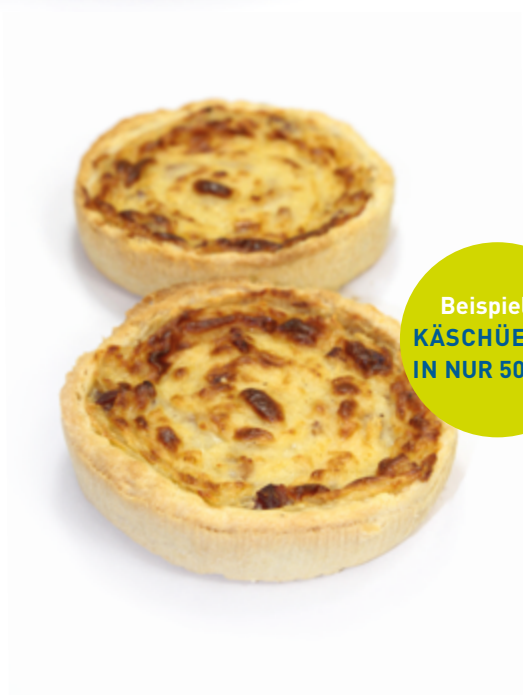
Beispiel 2: KÄSCHRÜECHLI IN NUR 50 SEK.