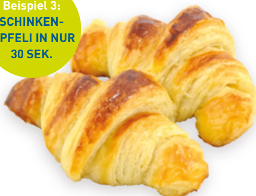
Beispiel 3: SCHINKEN- GIPFELI IN NUR 30 SEK.