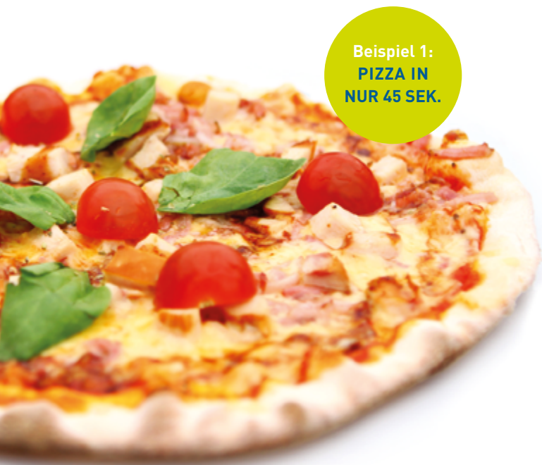
Beispiel 1: PIZZA IN NUR 45 SEK.